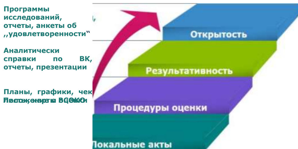
Рисунок 1 - Обеспечение ВСОКО

В ГБПОУ РХ «Хакасский многопрофильный техникум» (ГБПОУ РХ ХМТ) ВСОКО имеет четыре функциональных уровня (рис.1):